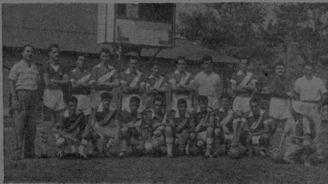
Equipo de futbol Contabilidad Deportiva, cuyos integrantes fueron trasladados a San José. Muy buenos recuerdo nos deja este magnífico equipo.