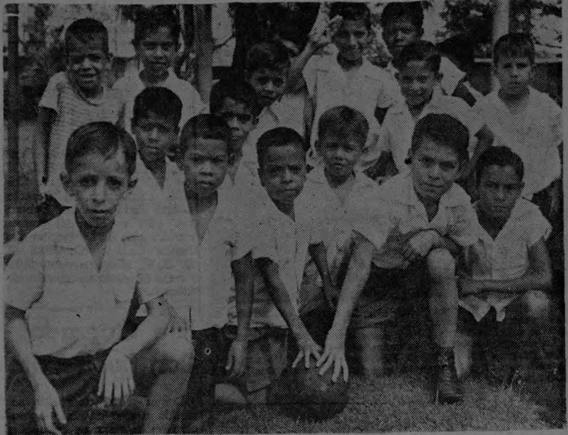
Nuestra cámara captó a los integrantes del equipo de fútbol de la Escuela de Palmar Sur después de un rato de darle al cuero en una práctica.