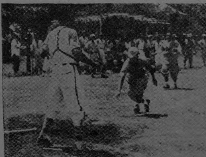
"Chico" Bustos de Finca Jalaca llega a tiempo a la casa grande para anotar la carrera con la que su novena ganó a Finca 15 en el Campeonato Relámpago jugado en el diamante de Palmar Sur el domingo 28 de julio. Buena pelota exhibieron todos los conjuntos participantes.