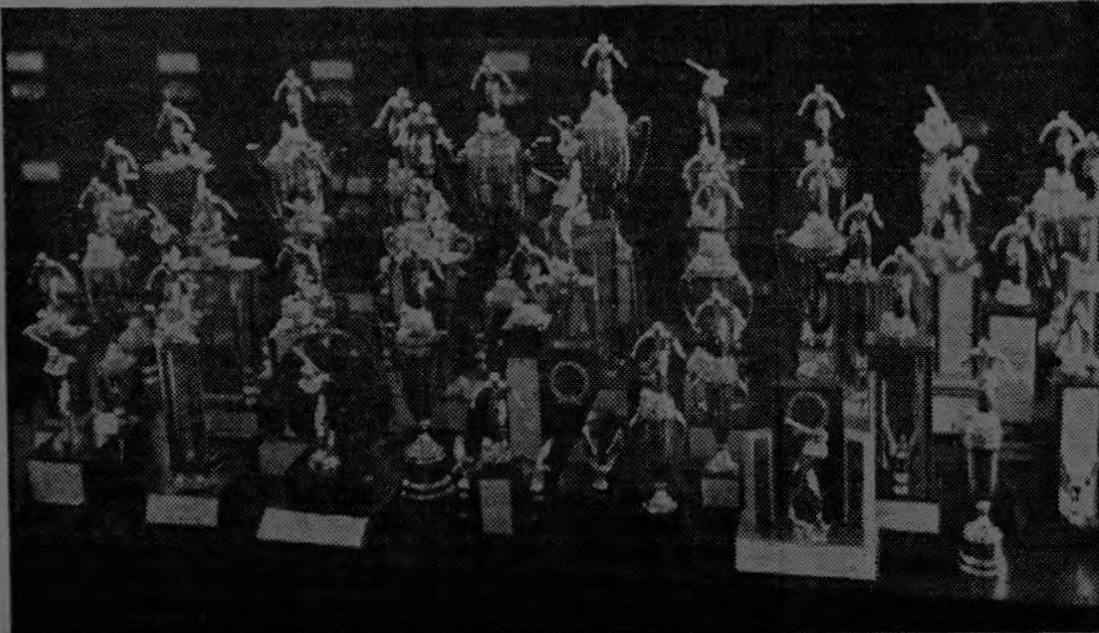
He aquí los trofeos que han sido donados por la Compañía Bananera de Costa Rica para los campeonatos del presente año que se desarrollan en toda la Zona Bananera. Hay trofeos para todos. Vamos a ver quienes los ganan.