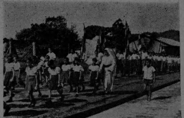
La población escolar de Golfito celebra el Décimo Aniversario de su cantonato.