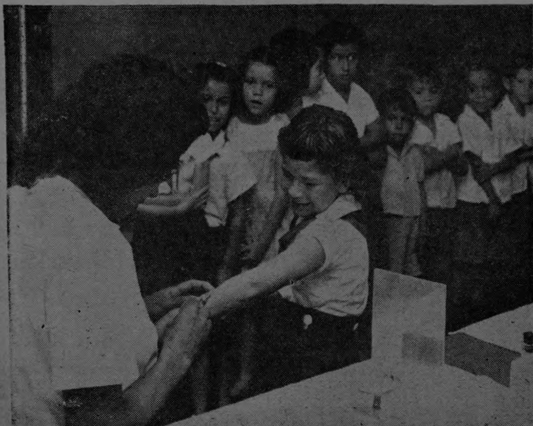
Grupo de niños de la Escuela de Palmar, hacen fila para recibir la vacuna contra la Tuberculosis. Todos los niños de la zona bananera han sido vacunados de acuerdo a un amplio programa del Ministerio de Salubridad Pública.